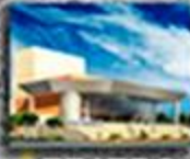
TEATRO DE LA CIUDAD