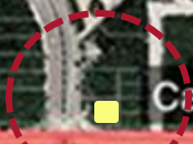
Casa de cultura